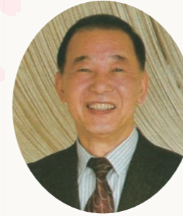
大阪公立大学教育後援会 会長