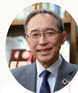
大阪公立大学 学長 大阪公立大学教育後援会 名誉会長

今後とも、学生の皆さんの教育・研究環境の改善、向上はもとより豊かなキャンパスライフの実現をめざして様々な支援活動を行ってまいりますので、保護者の皆様のご理解ご協力を賜りますようお願い申し上げます。